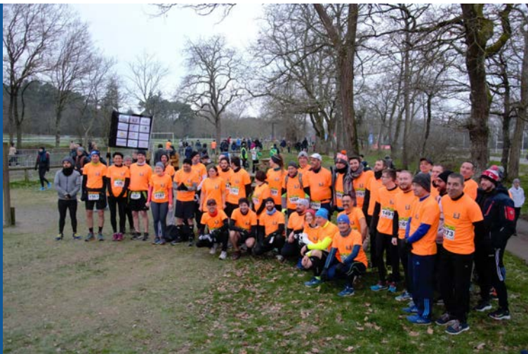
CROSS OUEST FRANCE