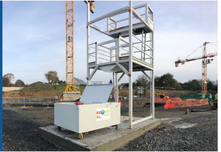
ECL ECONET CITY - Solution de traitement des eaux

Nous sensibilisons nos partenaires à la réduction de leur empreinte écologique