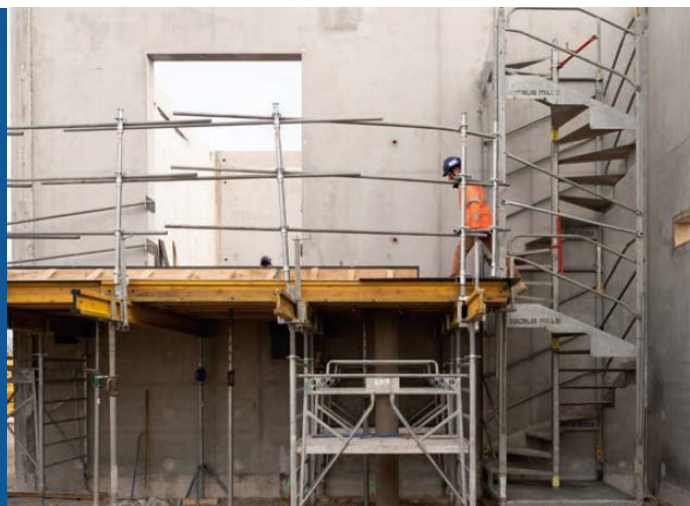
Escalier hélicoïdal - sécurise et facilite les accès et les déplacements sur un chantier