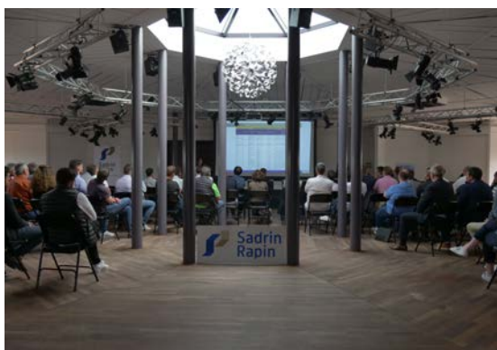
Forum des sous-traitants